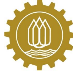
คณะกรรมการร่วมภาคเอกชน 3 สถาบัน จังหวัดกาญจนบุรี