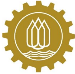
กกร. จังหวัดกาญจนบุรี

คณะกรรมการสามารถใช้ตราสัญลักษณ์ของ กกร. ได้ โดยต้องระบุว่าเป็น กกร. จังหวัดใด หรือ กลุ่มจังหวัดใด ในบรรทัดที่สอง ตามรูปแบบดังนี้