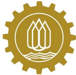
กกร. กลุ่มจังหวัดภาคเหนือตอนล่าง 1