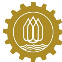
คณะกรรมการร่วมภาคเอกชน 3 สถาบัน จังหวัดกาญจนบุรี